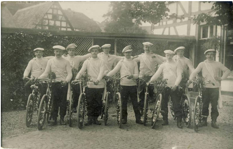
Radfahrverein „Schwalbe“ in den 1920er Jahren

Bei den älteren und neueren Fotos geht es um verschiedene Vereine im Daadener Land. Vom Skiverein Emmerzhausen bis zur Feuerwehr in Schutzbach in historischen Uniformen, von der Knappenkapelle Daaden bis zur Volkstanzgruppe Friedewald ist ein bunter Querschnitt von bestehenden, aber auch von mittlerweile historischen Vereinen abgebildet. So gehört beispielsweise der Radfahrverein „Schwalbe“ in Daaden ebenso der Vergangenheit an wie der Schützenverein in Derschen, während andere bereits im 19. Jahrhundert gegründete Gruppierungen immer noch aktiv sind, wie z. B. der Posaunenchor Oberdreisbach/Weitfeld. Der Westerwald-Verein Daaden e.V. ist auf dem Dezemberblatt anlässlich der Fackelwanderung zum Friedewälder Schloss zu erkennen.