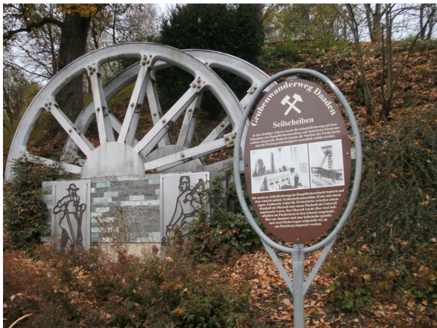
Station am Grubenwanderweg Daaden Seilscheiben der Grube Füsseberg