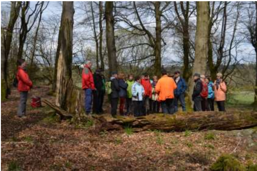
Wanderung über den Stegskopf