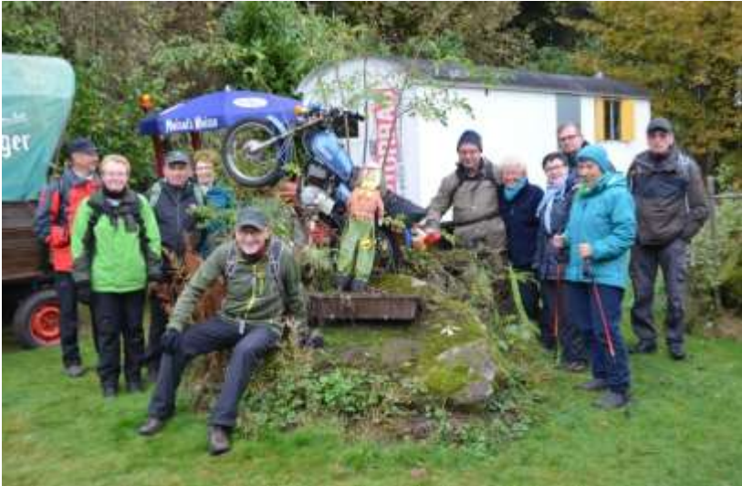
Wanderung Stadtwald Hachenburg 2016