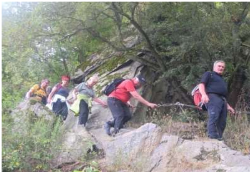
Am Ölsbergsteig 2016