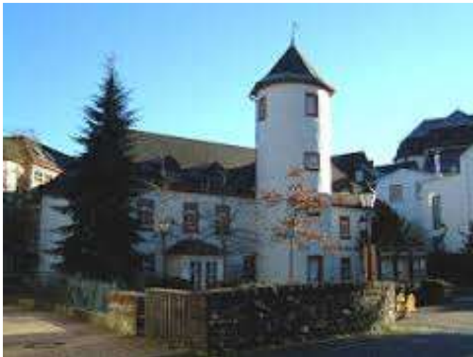
Alte Post Daaden