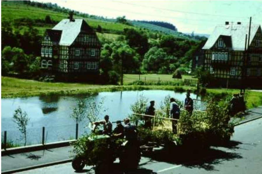
Umzug anlässlich des Westerwaldtages 1959 am Hüttenweiher in Biersdorf

Volker Rosenkranz hat die Geschichte von Derschen in einer 271 Seiten umfassenden Chronik zusammengestellt. Neben einer ausführlichen Beschreibung der geschichtlichen Ereignisse enthält das Buch auch Amüsantes und Nachdenkliches, eine ausführliche Darstellung der Steinches Mühle und die alten Hausnamen von Derschen.